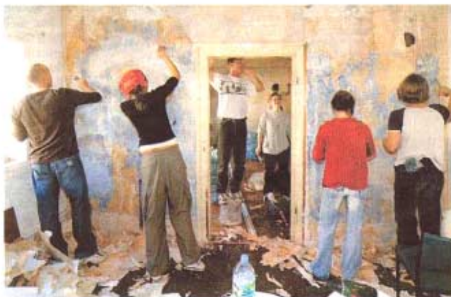
Fleißig am Werk: Mitglieder der „Stuttgart Connection“ haben dem Familienzentrum Gaisenhau einen neuen Anstrich verpasst.

Nach einem Aufruf zum Projekt „Familienzentrum Gaisenhau“ Ende Oktober konnten 22